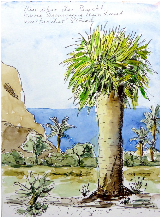
Hier über der Bucht keine Bewegung kein Laut wartender Pinsel