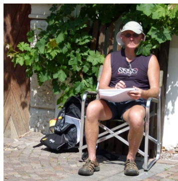
Ein toller Campingstuhl von Coleman.