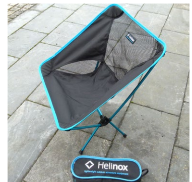
Erstaunlicher Sitzkomfort. Wiegt nur ein knappes Kilo und lässt sich sehr klein verpacken.